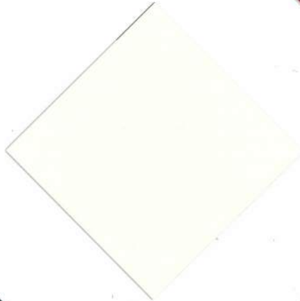
V-02 : アイボリー 透光率 6.78%