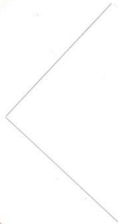
V-01 : ホワイト 透光率 6.31%