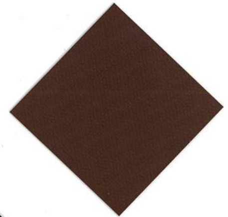
V-04 : ブラウン 透光率 0.03%