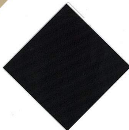
V-08 : ブラック 透光率 0.00%