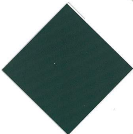
V-06 : プリティッシュグリーン 透光率 0.00%