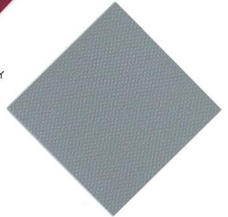
V-07 : シルバー 透光率 0.03%