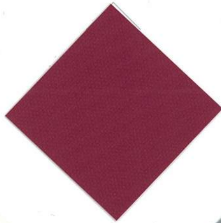
V-05 : バーガンディ 透光率 0.66%